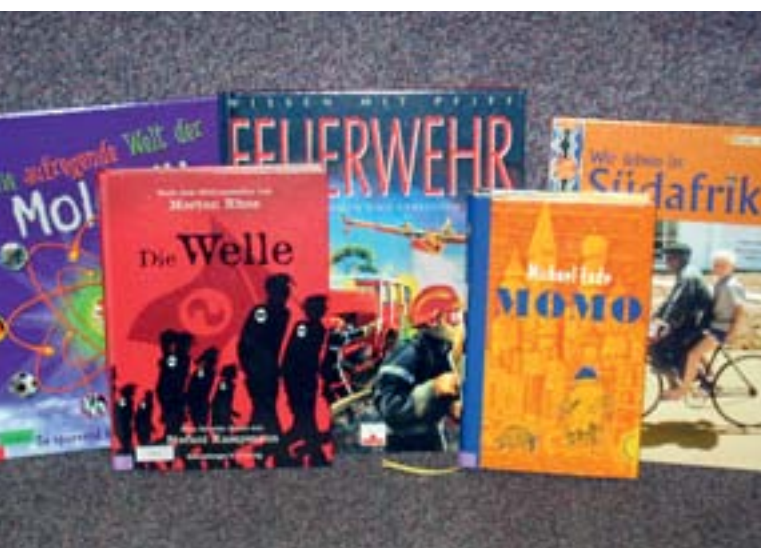
Eine kleine Auswahl der neu angeschafften Bücher