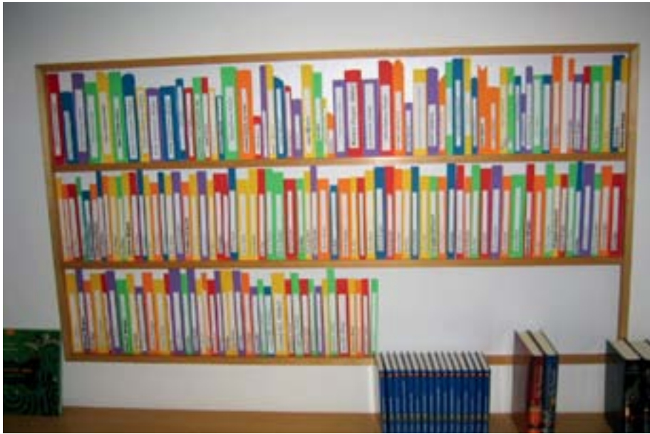
Das erste symbolische Gönner/innen-Büchergestell ist bald voll...